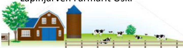
Lapinjärven Farmarit Osk.