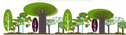
Maa- ja metsätaloustuottajat