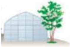
Robbes Lilla Trädgård